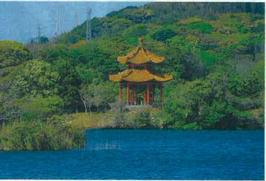
頓田貯水池のほとりに立つ大北亭

友人都市締結から昨年40周年を迎え、新型コロナウイルスの感染拡大では互いにマスクなど支援物資を送り合った。大北亭は、そんな両市のきずなの証しだった。（山下航）